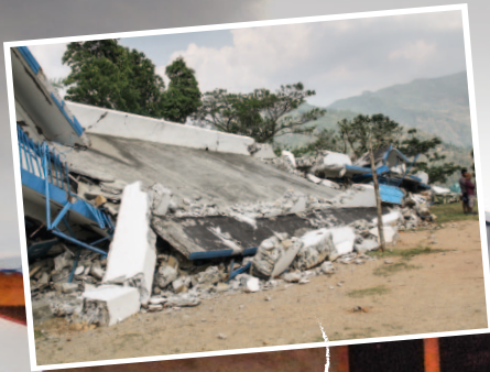
La escuela de Kadambas después del terremoto

(foto tomada dos semanas después del segundo terremoto)